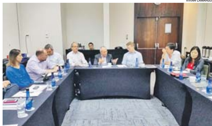
HARTUNG reuniu sua equipe de transição e especialistas durante seminário

> ASSUME cerimônia do Palácio Anchieta. Formada em Ciências Sociais e especializada em pesquisa pela Fundação Getúlio Vargas.