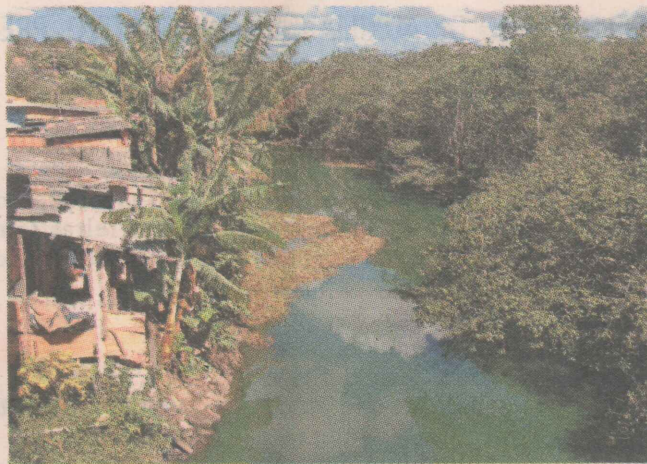
POLUIÇÃO. A água do rio está tão verde de sujeira e lodo, que não se vê mais o fundo dele, como nos tempos áureos.

MORADORES ESTÃO PREOCUPADOS COM A POLUIÇÃO DO RIO JUARA, ONDE HÁ ALGUM TEMPO ESTÃO APARECENDO PEIXES MORTOS