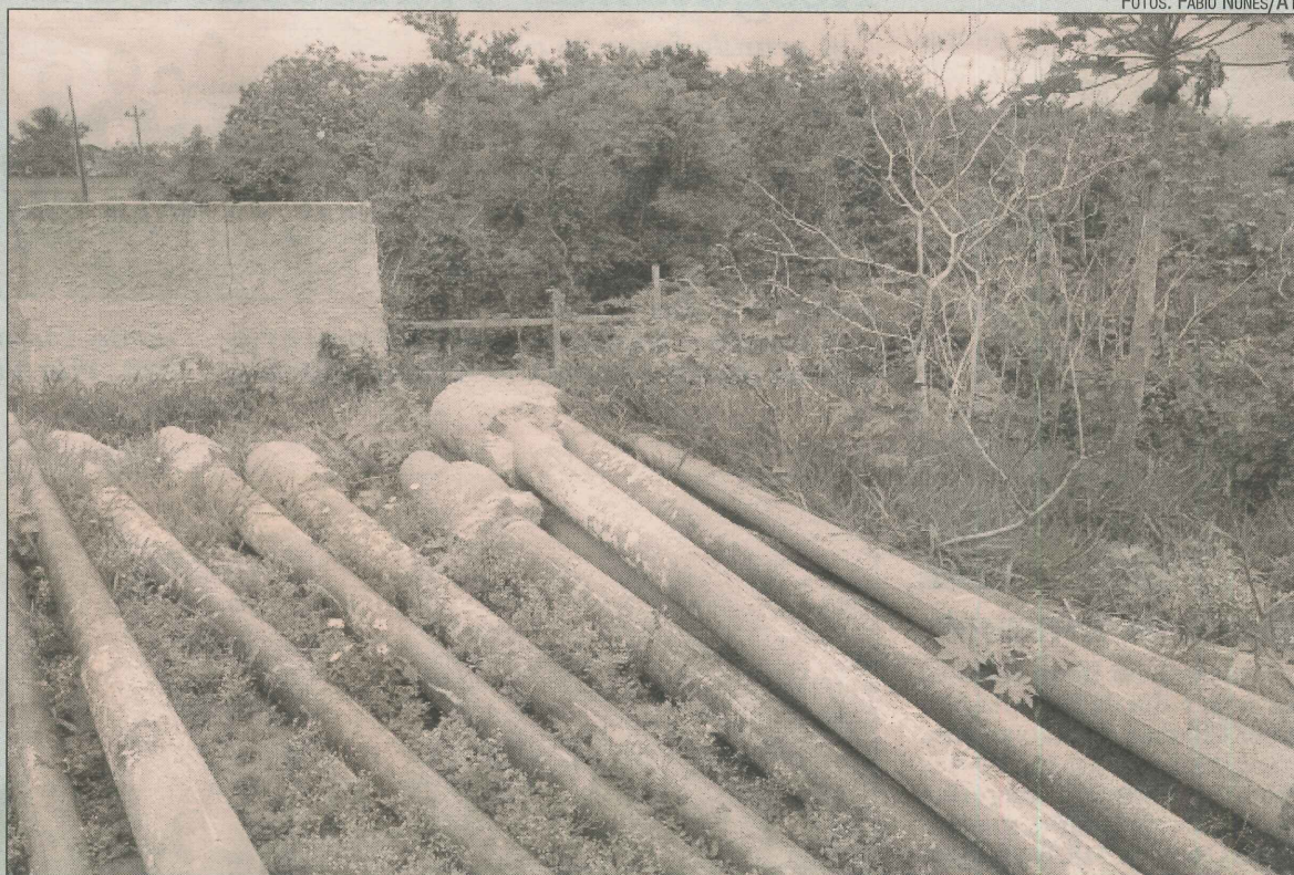
Área verde do bosque com restos de obras: limpeza até o final do mês