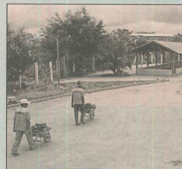
Obra em fase de conclusão

A Associação de Moradores de Serra Dourada II vai organizar o evento que acontecerá nos finais de semana. Na sede da associação, na avenida Brasília, já há uma barraca padrão que servirá de modelo para a feira comunitária.