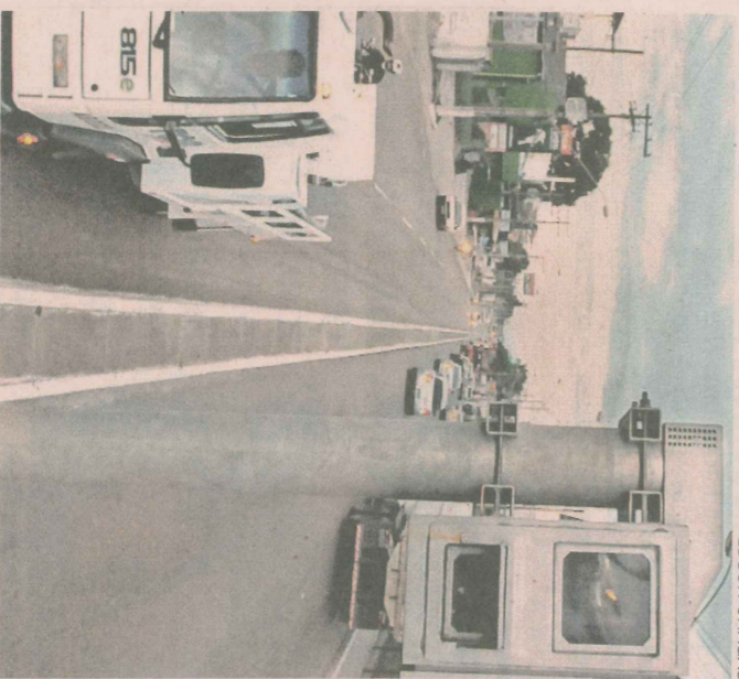
A Rodovia ES 010, na Serra, por exemplo, possui radar

◀ Nos primeiros seis meses deste ano, a Polícia Rodoviária Federal (PRF) registrou 29.488 condutores dirigindo com excesso de velocidade nas rodovias federais que cortam o Espírito Santo. A infração foi a que teve o maior número de notificações, com mais da metade do total de irregularidades: 53% de 54.609 multas. A PRF informa que todos os registros foram feitos com a presença de uma viatura junto ao equipamento.