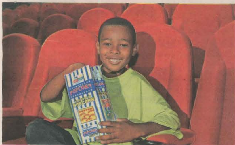
ESTUDANTE da Serra se prepara para assistir sessão de cinema

A Serra hoje pode ser considerada a capital brasileira do congo e é neste ritmo que acontece este mês a Festa de São Benedito, que é a maior manifestação folclórica do Espírito Santo. Este ano a festa completa 164 anos.