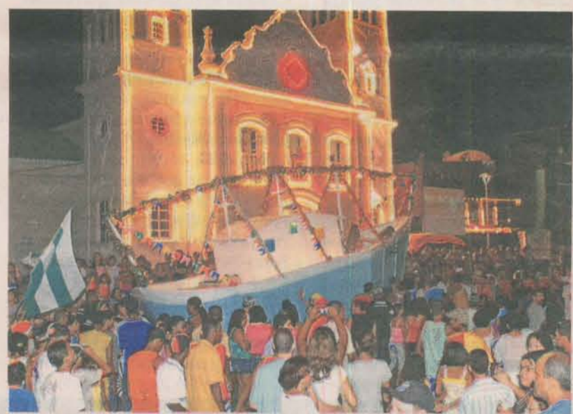
BANDAS DE CONGO participam das festividades realizadas no município

Esse bônus é obtido através da renúncia fiscal do município, proveniente do Imposto Sobre Serviço de Qualquer Natureza (ISSQN), em até no máximo 50% do valor devido pela empresa.