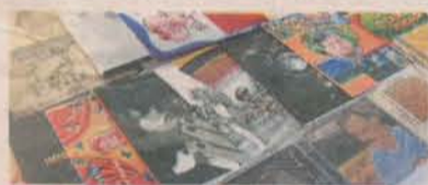
OBRAS beneficiadas por legislação

E acrescentou: "Além disso, é um incentivo à capacitação profissional dos professores de Artes e também para os alunos, que passarão a ser produtores de filmes num futuro próximo".