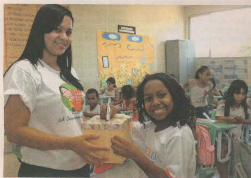
ALUNOS aprendem técnicas de meditação e fazem trabalhos em grupo