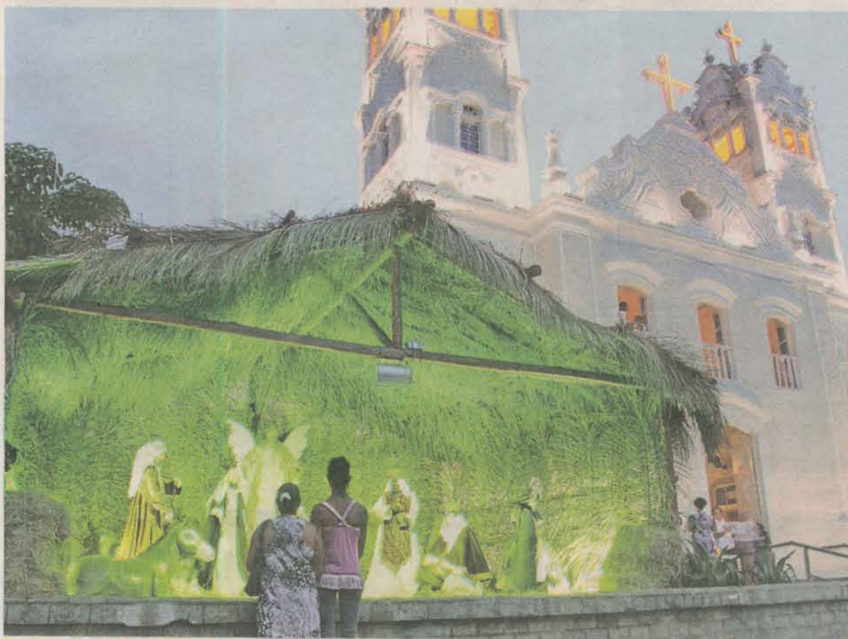
FAZEM PARTE DO PRESÉPIO de Natal o menino Jesus, José, Maria, os Três Reis Magos, além de animais

A prefeitura também retomou os estudos para a implantação de um aeroporto de cargas no município que deve estar localizado em uma área entre Nova Almeida e Jacaraípe. O Estudo de Viabilidade Técnica demandará recursos que chegam a R$ 140 mil e deve ser concluído em 2010.