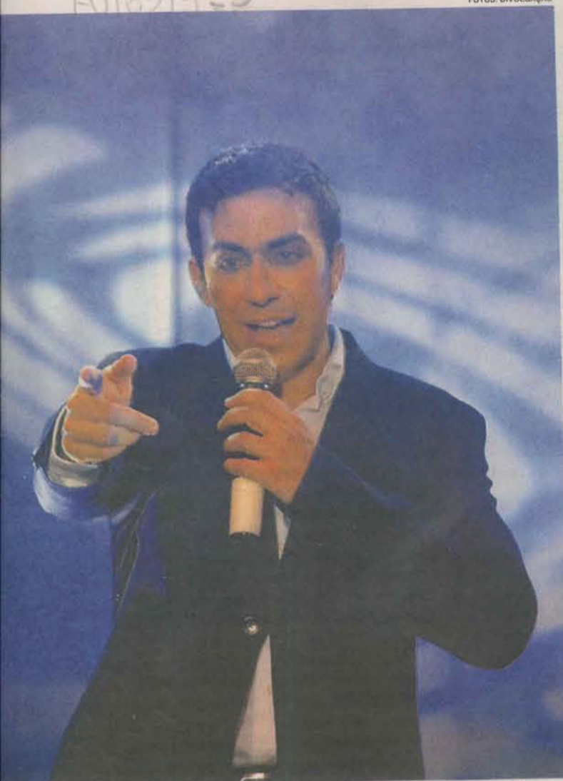
O PADRE FÁBIO DE MELO se apresenta na Serra na próxima sexta-feira