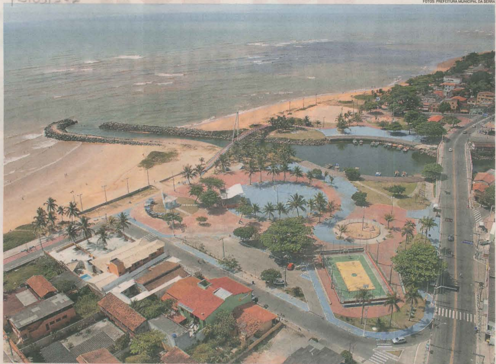
JACARAÍPE é um dos bairros da Serra que estão recebendo investimentos em diversas áreas. As obras irão beneficiar toda a população do município

A cidade responde por mais de 20% do Produto Interno Bruto (PIB) do Espírito Santo. É o muni-