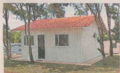
CASA POPULAR: esperança

Novo Horizonte já foram cadastradas pelo Serviço Social da Secretaria de Habitação da prefeitura e vão receber as chaves das casas no segundo semestre de 2010. O bairro está sendo contemplado com 324 moradias.