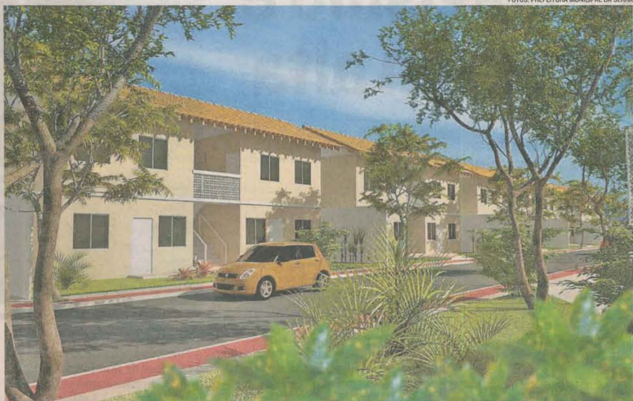
EM VILA NOVA DE COLARES serão construídos prédios de dois pavimentos com dois apartamentos

A prefeitura vai construir também em vários bairros da Serra 200 casas em estrutura metálica pré-fabricada com interior revestido em gesso. Com área de 41,4 metros quadrados, conta com sala, dois quartos, banheiro, cozinha,