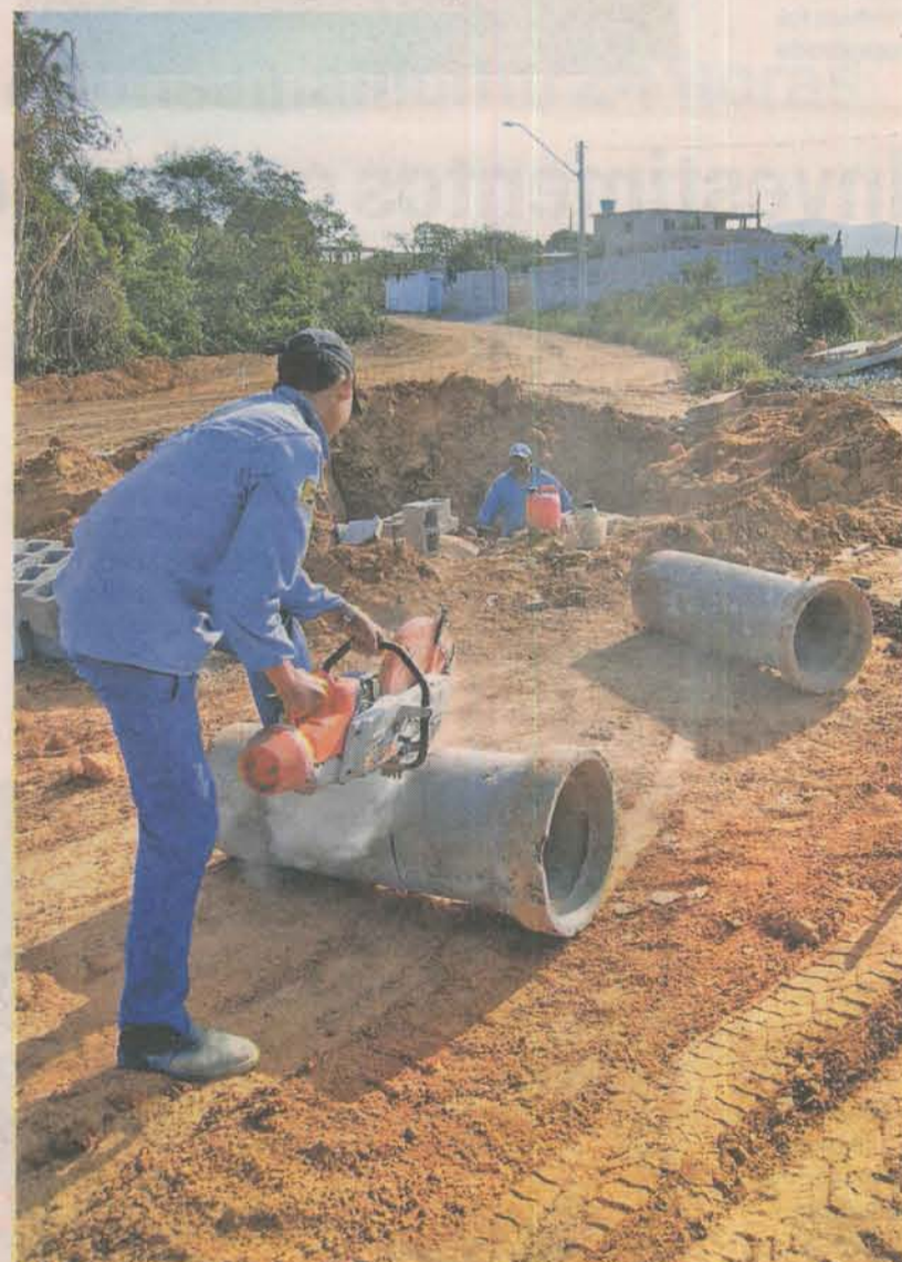
HOJE a cidade conta com 75% de cobertura de saneamento básico

das ruas, mudanças no trânsito, implantação de estacionamento rotativo na avenida Central, entre outras ações.