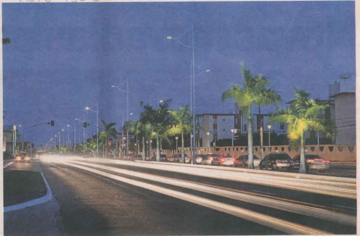
NA AVENIDA CIVIT II foram instaladas 165 luminárias decorativas, além de postes na ciclovia e no trecho principal

Também foram instalados 199 projetores que iluminam a vegetação e foram substituídas as lâmpadas a vapor de sódio por lâmpadas a vapor metálico.