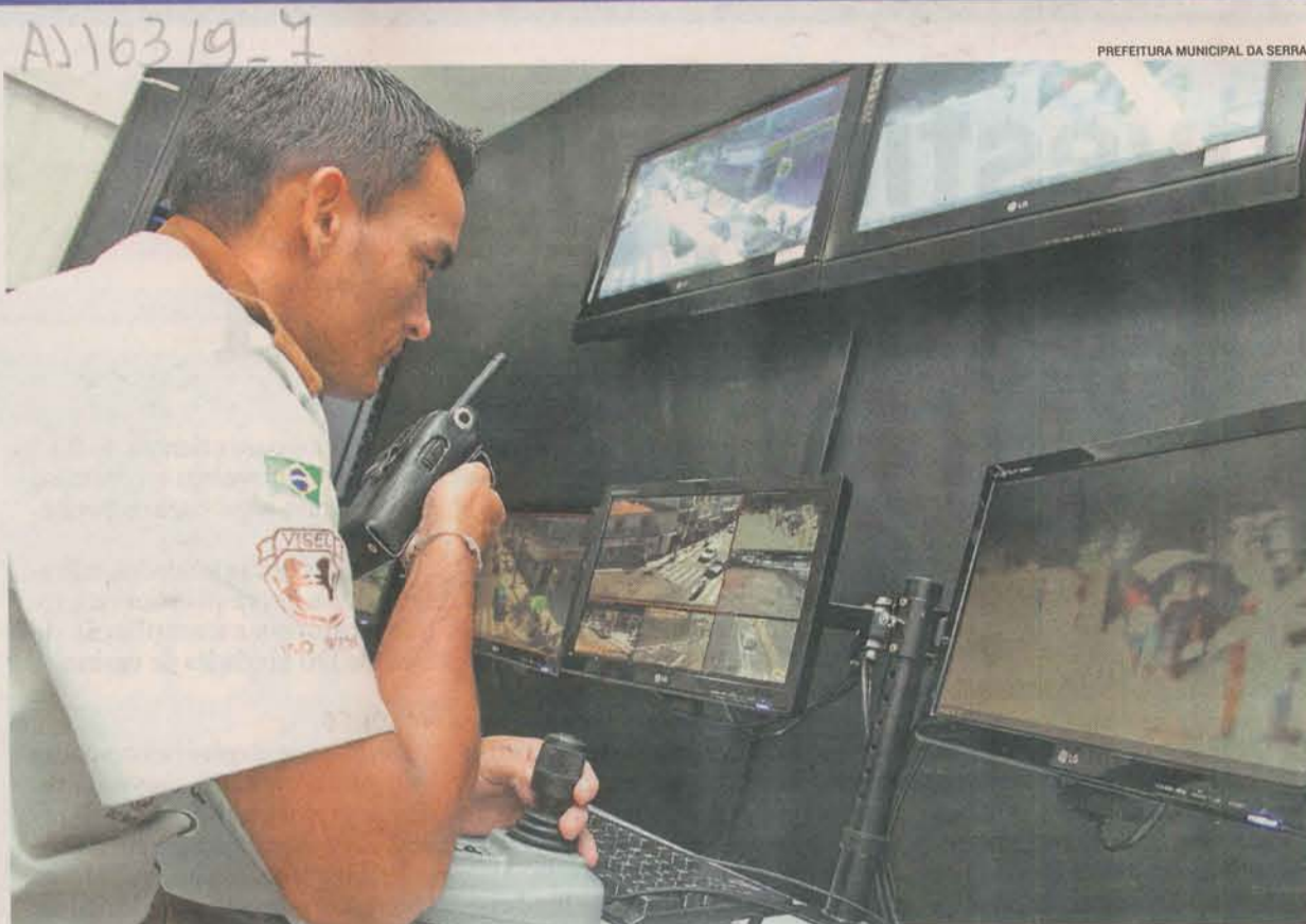
NA SERRA, alguns módulos de policiamento serão equipados com câmeras de videomonitoramento

quadrados de área (7 metros de comprimento, 4 de largura e 3 de altura). Cada módulo terá um banheiro com sanitário, armários para guardar equipamentos, um balcão e um banco de oito lugares para atendimento ao público.