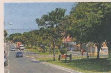
PAISAGISMO: cidade valorizada

A Prefeitura da Serra também tem investido cada vez mais em obras de paisagismo, tornando a cidade ainda mais bonita. Esses trabalhos melhoram a auto-estima da comunidade, valorizam o patrimônio do cidadão e contribuem de forma decisiva para o desenvolvimento do turismo.