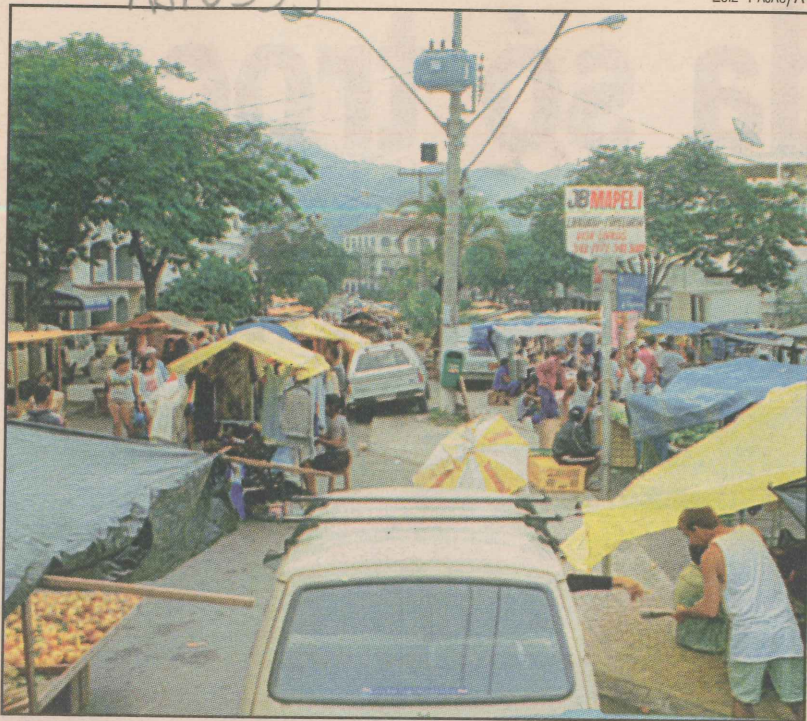
Na região, os moradores contam com comércio diversificado