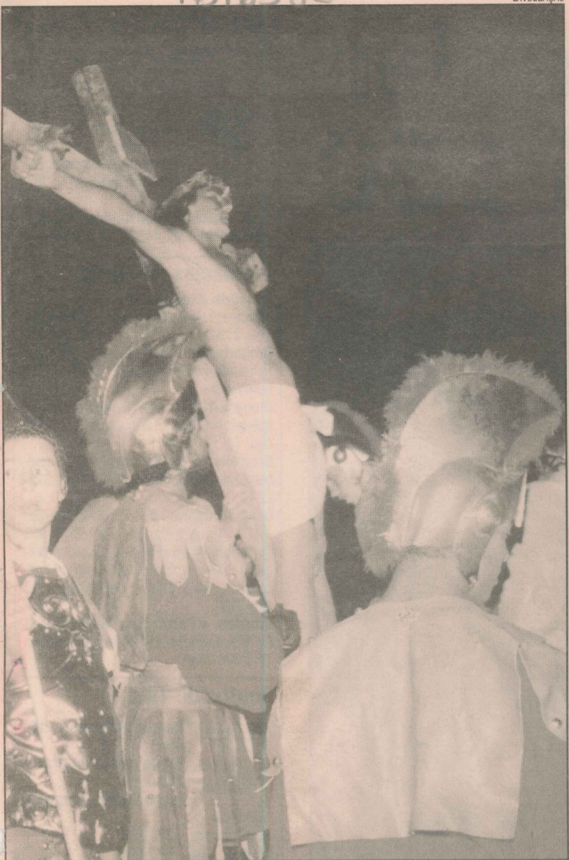
Atores encenam o tradicional espetáculo religioso