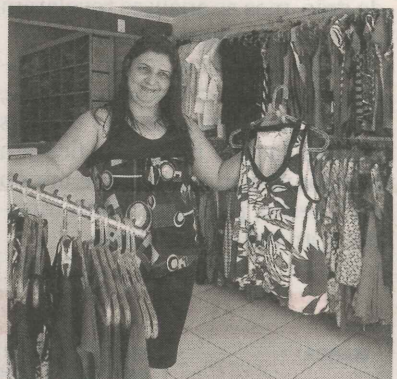
LEIDE conquistou clientes no bairro

"As pessoas para quem eu costurava continuam comprando comigo."