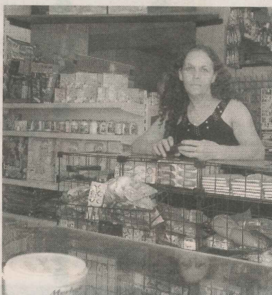
ELIZABETE entre mercadorias