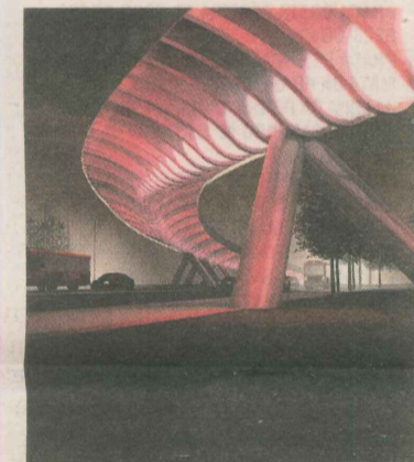
PERSPECTIVA do viaduto