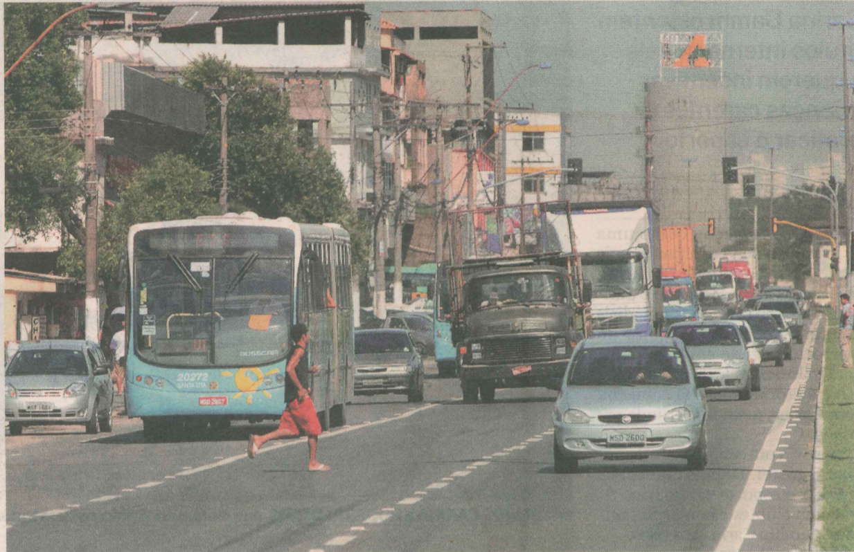
AVENIDA Carlos Lindenberg está sendo adaptada para receber os corredores exclusivos para ônibus

Ela explicou que, inicialmente, devem ser duas frentes de trabalho, em Vila Velha e na Serra, que também deve começar a implementação do projeto.