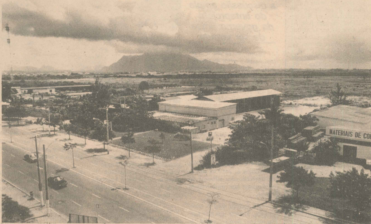
Os bairros localizados na região do aeroporto de Vitória terão de continuar como estão: sem edifícios

são das prefeituras e do governo do Estado, com exceção da Prefeitura de Vitória, de áreas específicas para o crescimento urbano.