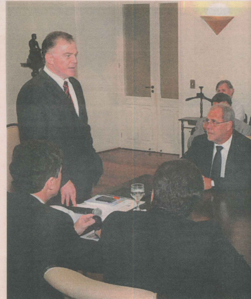
CASAGRANDE destacou que a ferrovia vai atrair novos investimentos