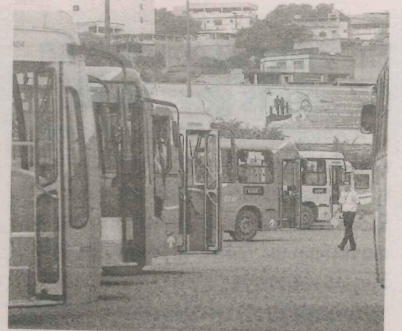
ÔNIBUS DO TRANSCOL: reforço