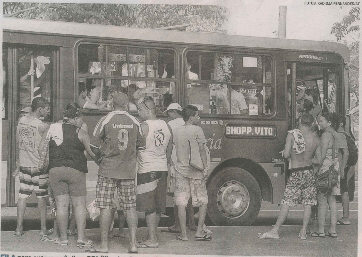
FILA para entrar no ônibus 331 (Ilha das Caieiras/Praia do Suá - via Shopping Vitória), na Curva da Jurema

O reforço nas linhas é das 8 às 19h30. Os horários de pico, segundo o diretor-presidente da Ceturb-GV, são das 9 às 10 horas e das 16 às 17 horas. A operação deve continuar até o fim de fevereiro.