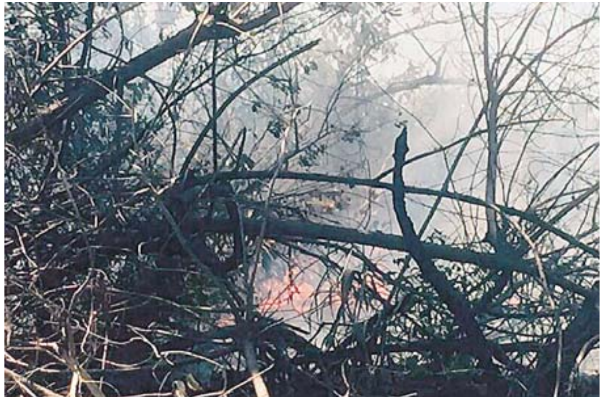
ÁREA de proteção ambiental, no bairro Nova Ponta da Fruta, em Vila Velha, atingida por desmatamento e fogo

“Quando eu vejo, já está cortado ou pegando fogo. Liguei para Secretaria de Meio Ambiente e para a polícia, mas não teve resultado. Isso aqui é área de preservação ambiental. Ontem mesmo veio uma equipe do Parque Paulo Cesar Vinha para apagar o fogo”.