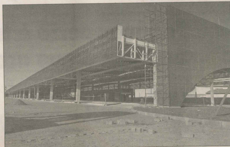
Terminal de Itaparica vai ser inaugurado em março

Fonte: Companhia de Transportes Urbanos da Grande Vitória (Ceturb-GV).