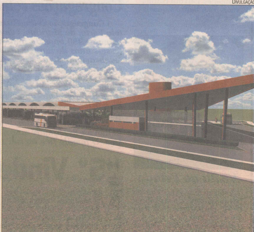
Ilustrações do novo terminal, que terá linhas para as praias de Manguinhos, Bicanga, Jacaraípe, Nova Almeida e Praia Grande