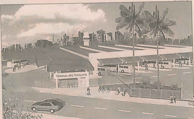
Projeto do novo Terminal de São Torquato, em Vila Velha

Os quatro terminais serão construídos simultaneamente. O edital da Ponte da Passagem também sai hoje