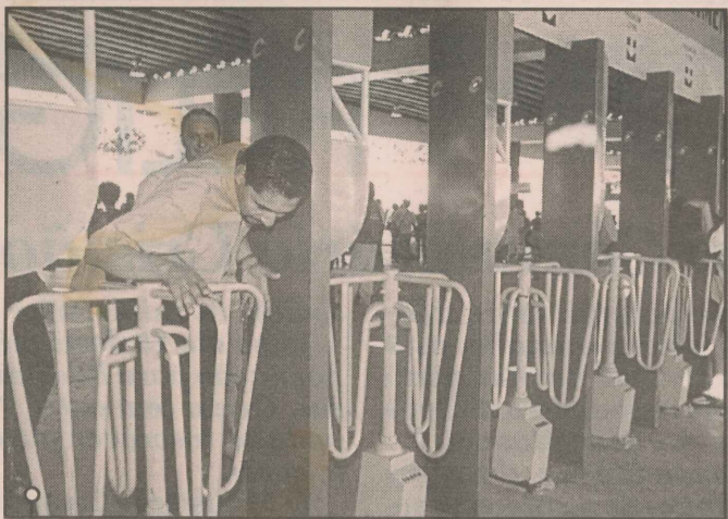
Em Campo Grande, onde o terminal foi considerado modelo, diretor conferiu o funcionamento das roletas.