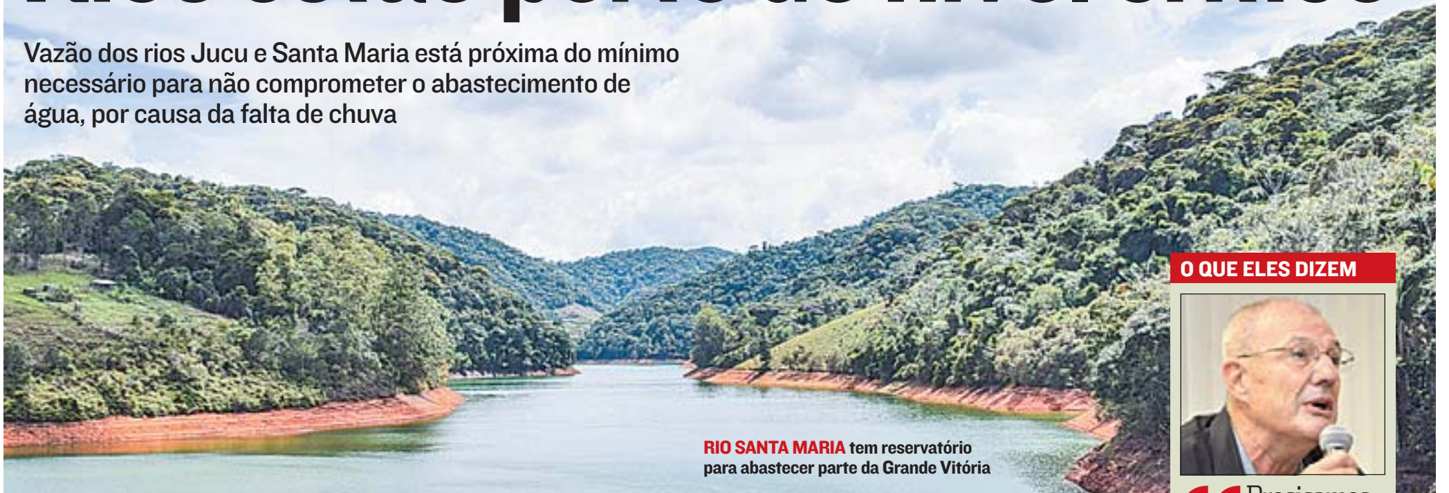
RIO SANTA MARIA tem reservatório para abastecer parte da Grande Vitória

Vazão dos rios Jucu e Santa Maria está próxima do mínimo necessário para não comprometer o abastecimento de água, por causa da falta de chuva