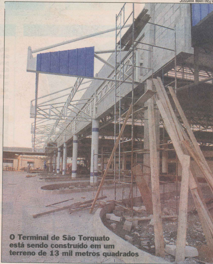
O Terminal de São Torquato está sendo construído em um terreno de 13 mil metros quadrados

O Terminal de São Torquato, que possui 4,4 mil metros quadrados de construção em um terreno de 13 mil metros quadrados, contará com nove linhas troncais, que o ligam às outras estações do Transcol na Grande Vitória, e 10 alimentadoras, que levam passageiros dos bairros da região ao terminal.