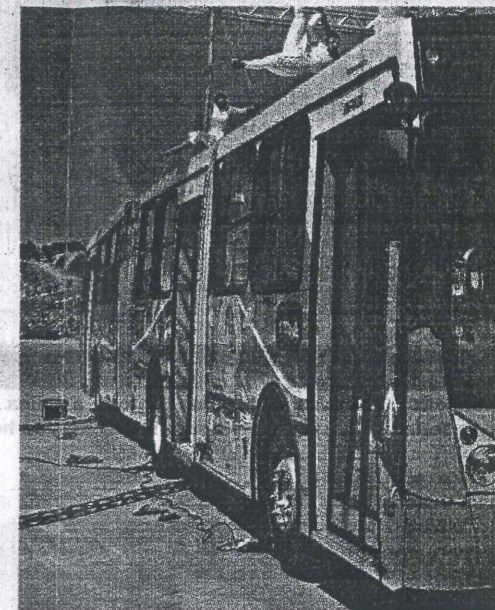
CARA NOVA. Ontem foi apresentado o novo layout q

Segundo a assessoria de imprensa da Ceturb, o intervalo médio de saída entre as viagens das três linhas que serão atendidas pelos novos ônibus é de 5 minutos, em média, nos horários de pico.