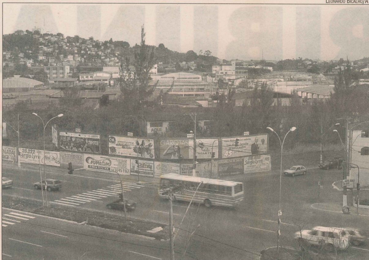
Terreno onde será construído o Terminal de Jardim América, na BR-262

A estação de transferência de São Torquato, Vila Velha, ocupa-