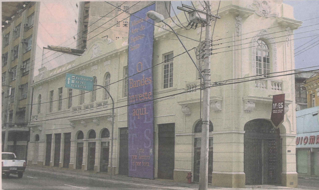
Localizado no Centro de Vitória, o museu deverá ser ocupados por intervenções artísticas a partir de amanhã