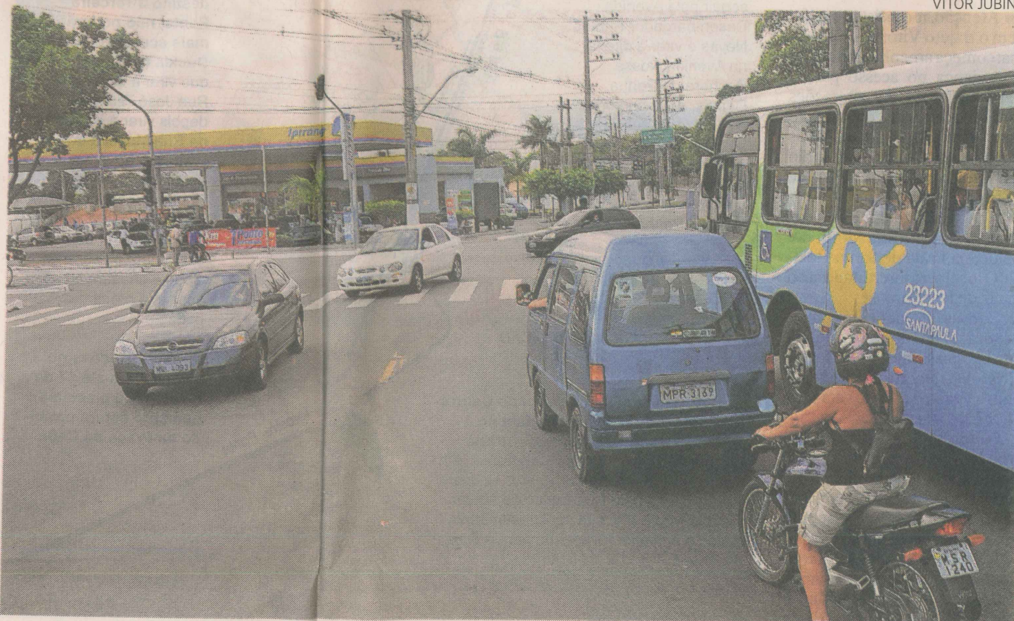
PREVISTO. Um mergulhão deve ser construído no cruzamento da Avenida João Palácio com a Rodovia Norte-Sul, no bairro Eurico Salles

Na outra extremidade da Avenida João Palácio no cruzamento com a Avenida Norte Sul, também há previsão para se construir um mergulhão para desafogar o tráfego, especialmente nos horários de pico. "Essas são as duas principais entradas e saídas da cidade, e as intervenções precisam