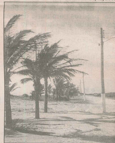
Pontal do Ipiranga: mudanças