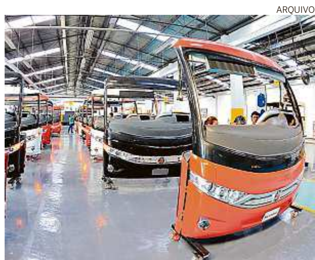
Fábrica da Marcopolo: um dos investimentos da região