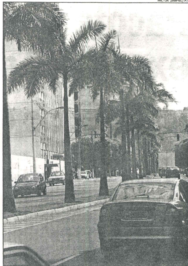
Projeto que muda PDU na avenida deve ser votado hoje