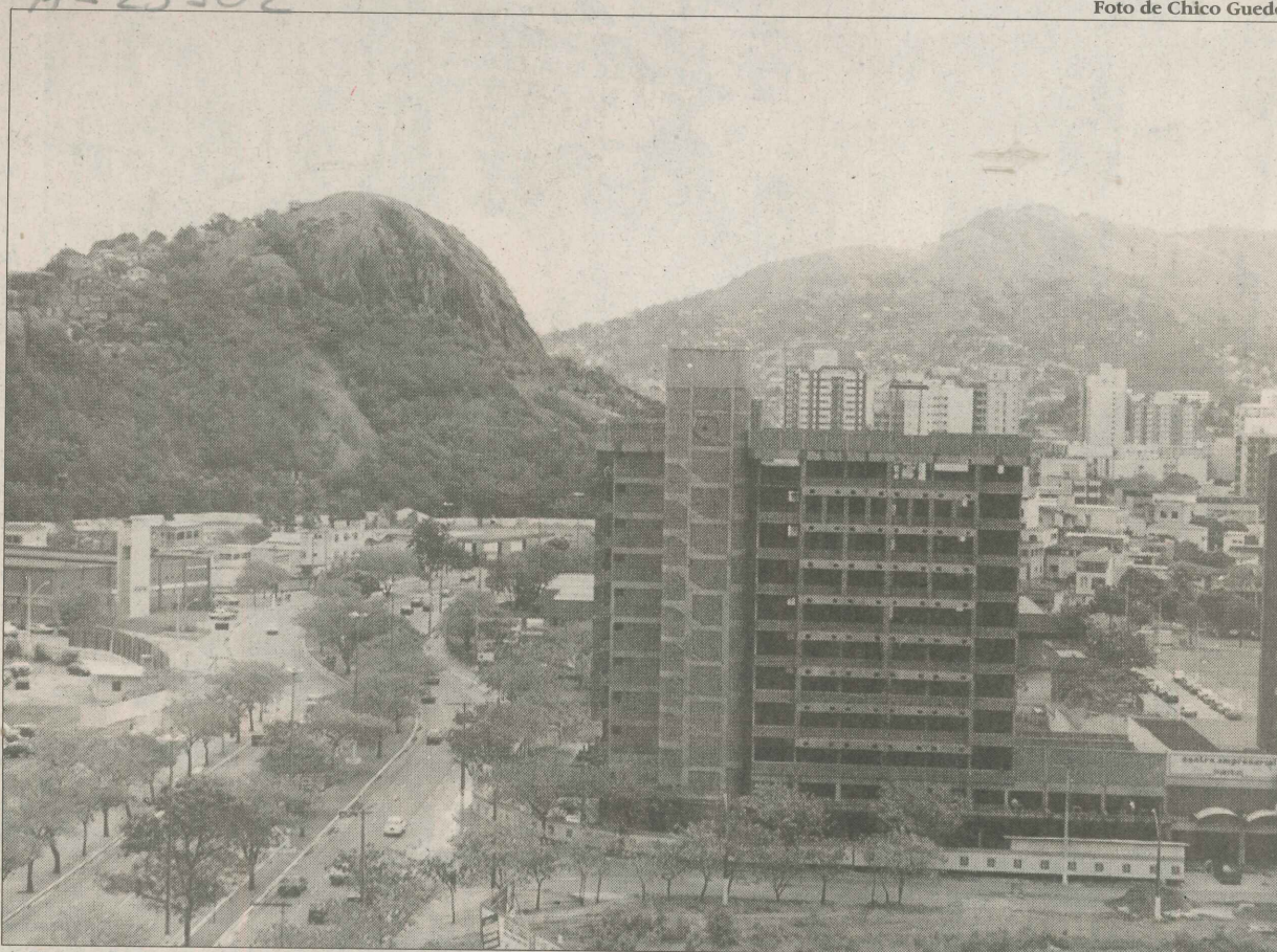
A Enseada do Suá é um dos locais onde a Prefeitura quer que as construções tenham limite de dois andares

Um projeto que prevê a construção de um prédio de 15 andares numa quadra, antes do Shop-