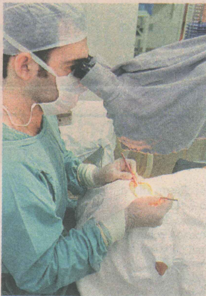
PREVENÇÃO. A partir dos 40 anos é aconselhável fazer o exame de medição da pressão intra-ocular.

O tipo mais comum é o glaucoma primário de ângulo aberto, considerado pela Organização Mundial da Saúde (OMS) como a segunda causa mais freqüente de cegueira irreversível em todo o mundo.