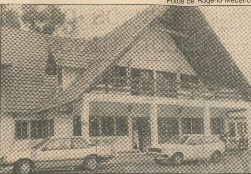
Espaço e lazer não faltam para o hóspede de qualquer dos três hotéis: em Pedreiras, interior do Espírito Santo: Pousada da Pedra Azul, Pousada do Pinho e Caesar Park