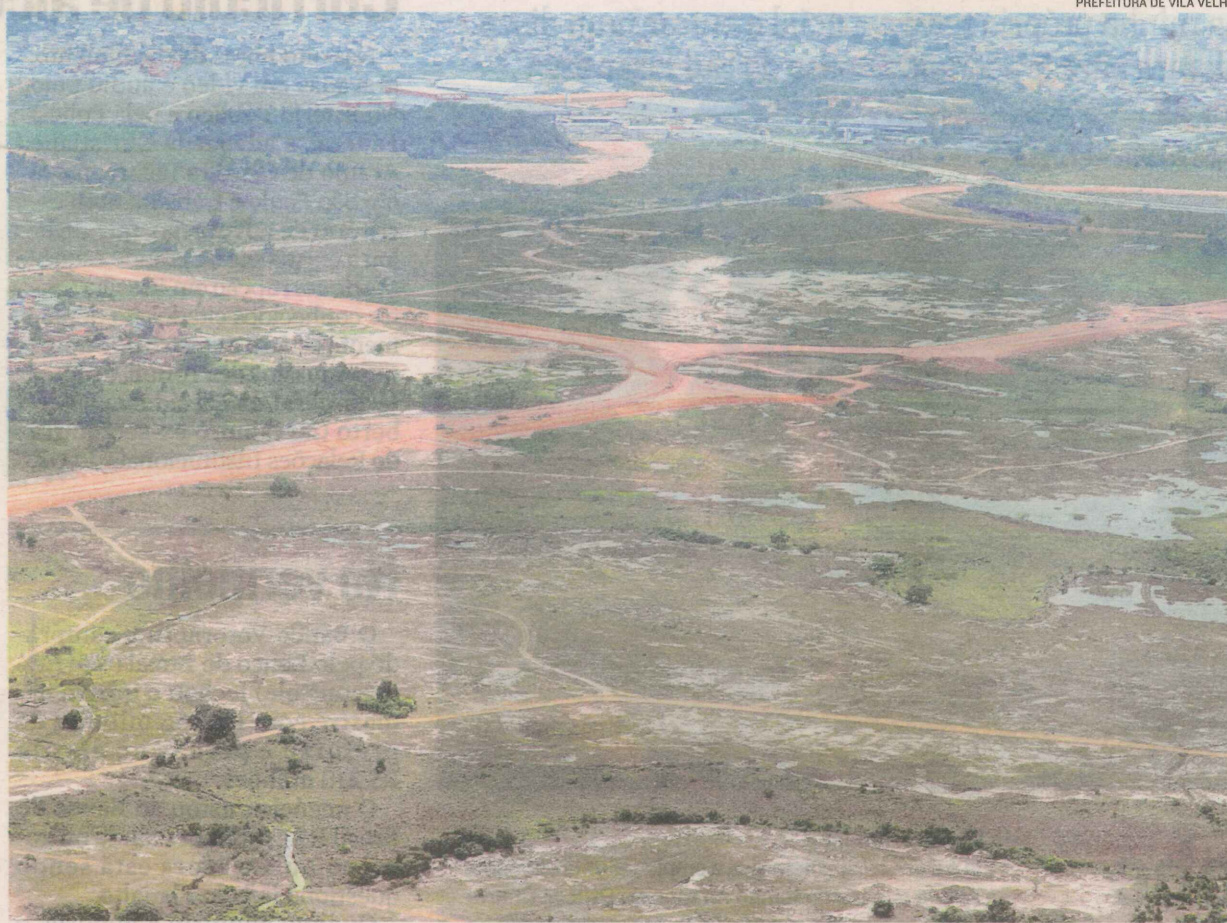
REGIÃO ONDE será construído o condomínio, que se transformará em um bairro: para moradias, lojas e empresas

preendedores já fecharam contrato com os donos da área, mas ainda não apresentaram o projeto. “Por enquanto, a empresa está tomando conhecimento do Plano Diretor Municipal (PDM).”