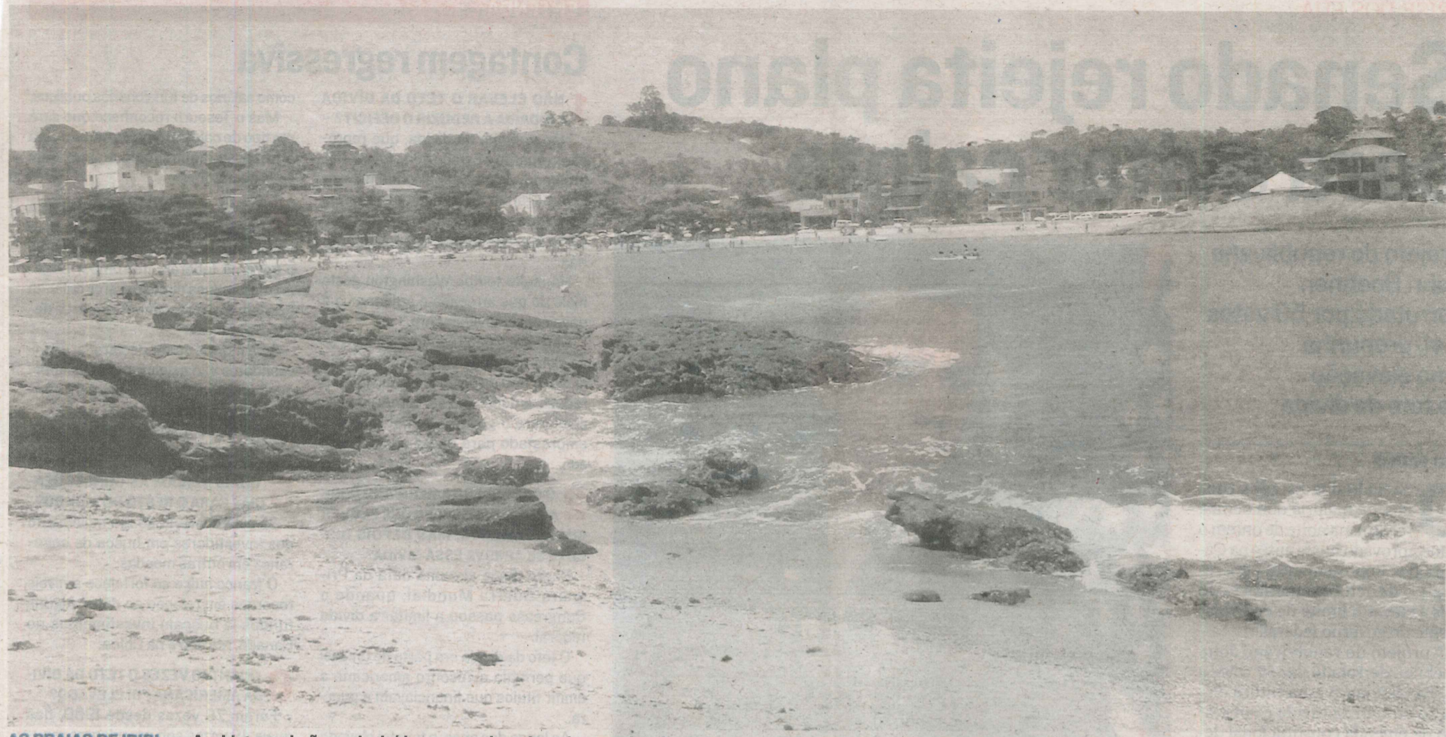
AS PRAIAS DE IRIRI, em Anchieta, poderão ser incluídas na rota do turismo internacional com os novos projetos, que incluem um complexo de lazer e também condomínios de casas