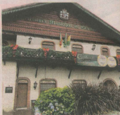
PREFEITURA de Gramado