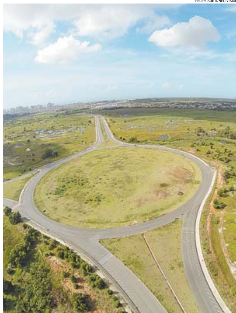
RODOVIA LESTE-OESTE teve as obras retomadas na semana passada

“Se lançarmos um olhar para 2019, identificamos que os passos que estamos dando podem ser feitos com segurança para converter os investimentos em qualidade de vida para a população”, defendeu.