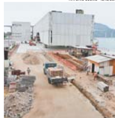
CAIS DAS ARTES será concluído

mento de associações de catadores de materiais recicláveis, e concessão de crédito, no valor de R$ 20 milhões, para promoção da economia verde.