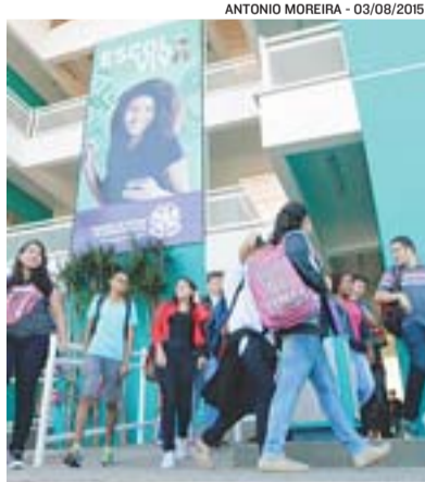
ESCOLA VIVA será ampliada

ma e modernização de 130 escolas nos próximos quatro anos.