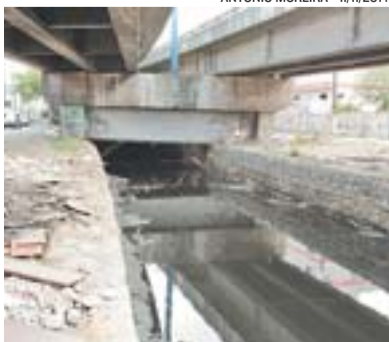
CANAL DA COSTA: obras