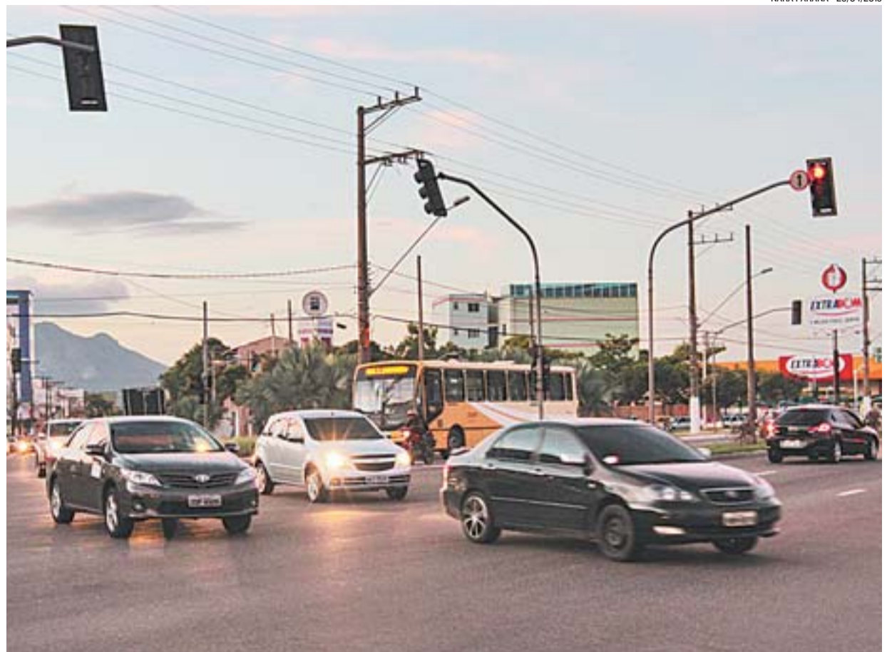
CRUZAMENTO DA FERNANDO FERRARI com a avenida Adalberto Simão Nader vai receber um viaduto