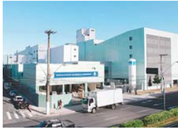
HOSPITAL ESTADUAL DE URGÊNCIA E EMERGÊNCIA, o novo São Lucas, vai ter pronto-socorro e novos leitos de UTI