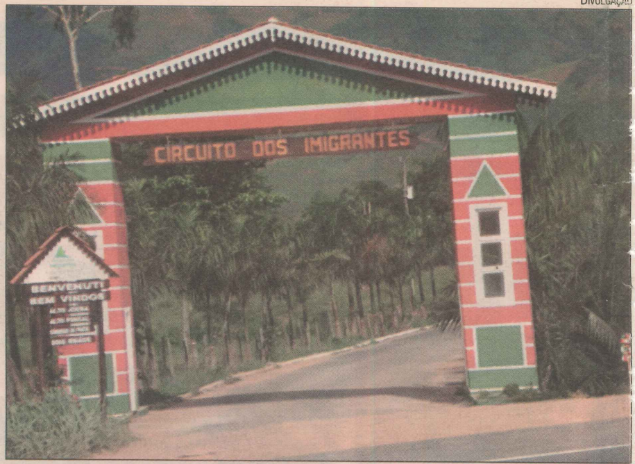
Entrada de Alto Pongal, onde começa o Circuito dos Imigrantes

tigadas pela ressaca do mar, as prefeituras estão fazendo obras de contenção, que devem ser concluídas nos próximos dias.