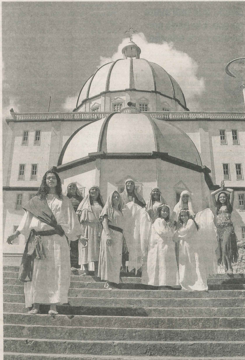
ATORES já estão ensaiando na escadaria da Basílica de Santo Antônio

Os moradores de Santo Antônio, Vitória, podem sugerir reportagens e reivindicar melhorias para o bairro. Basta que depositem as dicas na urna do projeto A Tribuna com Você , na Banca Valverde, no contorno de Santo Antônio.