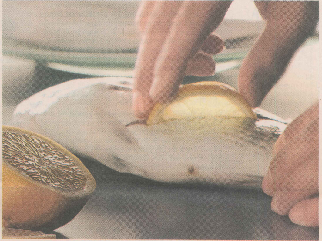
LIMPEZA. Depois de mexer com peixe ou frutos do mar, lave as mãos com um pouco de leite gelado, para que não fiquem cheirando.

Calcule o feijão: uma xícara de feijão cru serve três pessoas depois de pronto. E para descongelar frutos do mar, coloque o pacote ou vasilha na geladeira e deixe descongelar lentamente, sem tirar da embalagem.