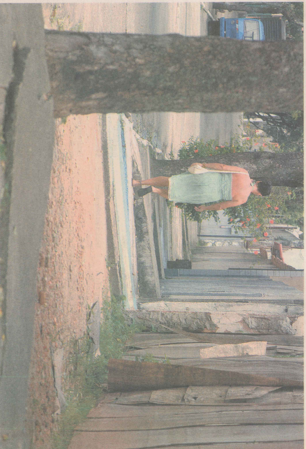
PERIGO. Pedestres precisam transitar por calçadas esburacadas ou com fendas provocadas por raízes de árvores.