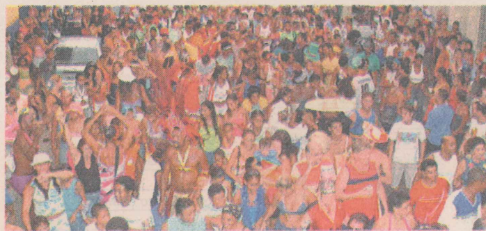
HISTÓRIA. Bloco desfila no carnaval, pelas ruas do bairro, há cerca de 15 anos.

Com isso, as pessoas que sempre desfilavam no bloco ficaram sem opção no carnaval e passaram a viajar para o litoral do Estado. Até que, numa tarde de carnaval, há cerca de 15 anos, alguns moradores que não queriam curtir o reinado de Momo nas praias capixabas, se reuniram em um bar do bairro para tocar sambas. Vestidos de mulher, passa-