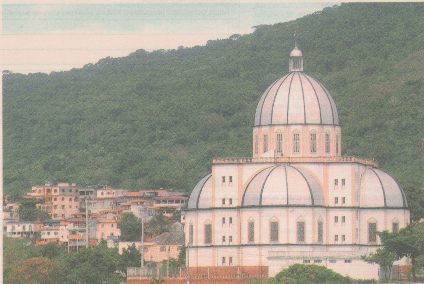
ESTILO. Chamam a atenção na arquitetura do santuário a cúpula central e a planta em forma de cruz.

TOME NOTA: Amanhã, confira as entrevistas com comerciantes de sucesso. E no sábado, tem mapa do bairro.