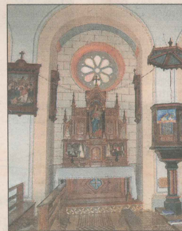
Igreja do Tirol