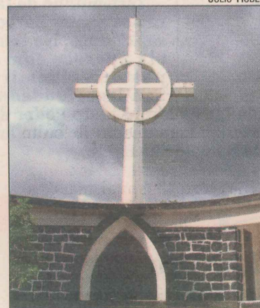
Monumento ao Imigrante