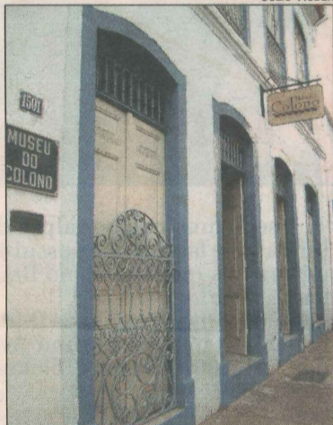
Museu do Colono