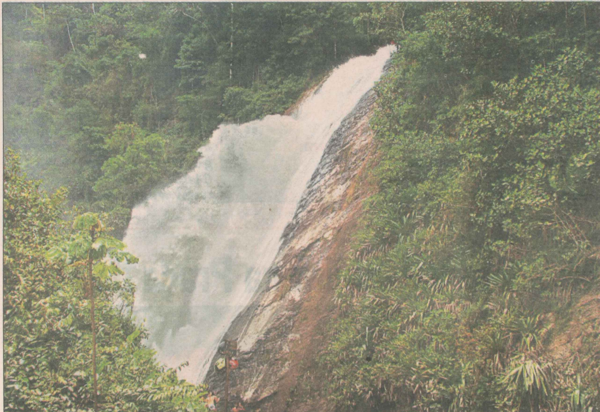
A Veu de Noiva é uma das belezas do Circuito das Cachoeiras, em Santa Leopoldina

COORDENADORIA DE COMUNICAÇÃO DE SANTA LEOPOLDINA