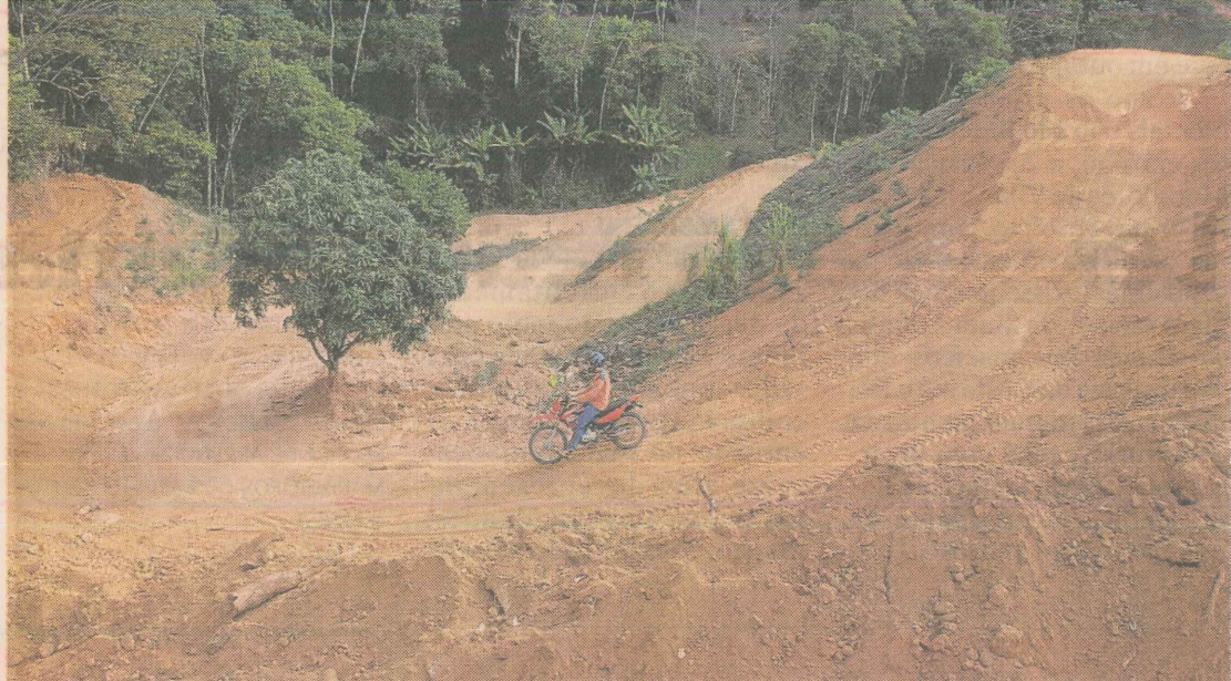
VELOCIDADE. Uma pista de supercross será inaugurada na região no próximo domingo

■ ■ VEJA NA WEB Confira mais fotos do Vale do Caravaggio no www.gazetaonline.com.br