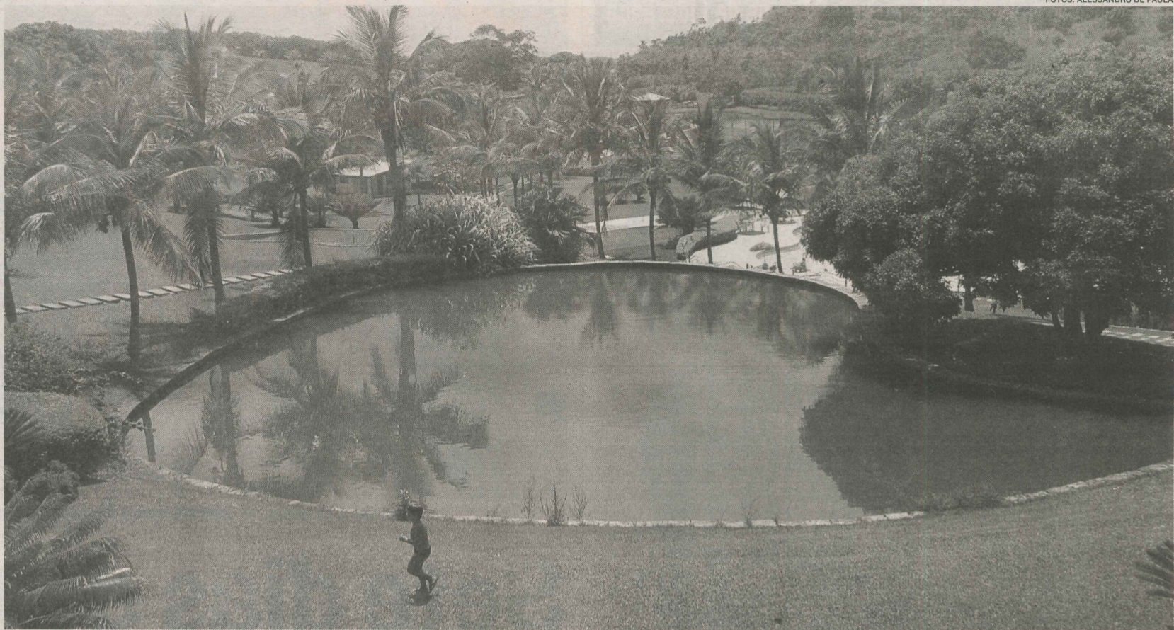
ECO PARK, em Itaoca, é uma das opções de lazer oferecidas dentro das atrações dos roteiros turísticos de Itapemirim, localizado no Sul do Estado

“O que queremos é que o turista seja bem atendido e a qualquer horário. Ele não pode, por exemplo, chegar a um estabelecimento num final de semana e encontrá-lo fe-