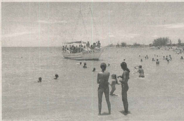
PASSEIO DE ESCUNA pelo litoral de Itapemirim