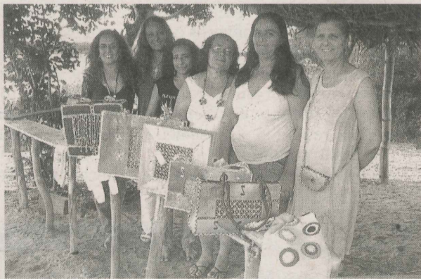
ARTESÃS mostram peças confeccionadas na região