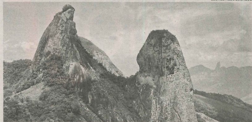
O FRADE E A FREIRA: prática de esportes radicais como voo livre e rapel