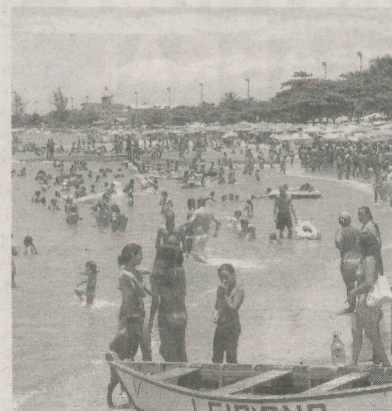
PRAIA DE ITAOCA no último verão

► CASA DO ARTESÃO – ITAOCA: mantida pelas mulheres artesãs de Itapemirim, a Casa do Artesão comercializa peças de artesanato e produtos rurais. Há espaços para shows de artistas da terra.