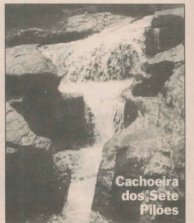
Cachoeira dos Sete Pilões

• Pedra Escorada – Situada no distrito de Limo Verde, em Divino de São Lourenço, o espaço recebeu o nome por