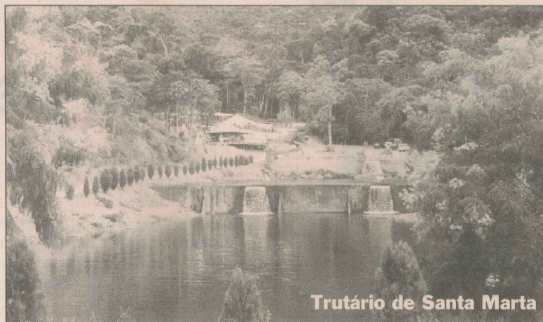
Trutário de Santa Marta

• Cachoeira do Granito – Localizada no distrito de Santa Marta, em Ibitirama, a cachoeira fica completamente dentro de uma rocha maciça, daí o nome. Forma uma seqüência de poços de águas cristalinas.