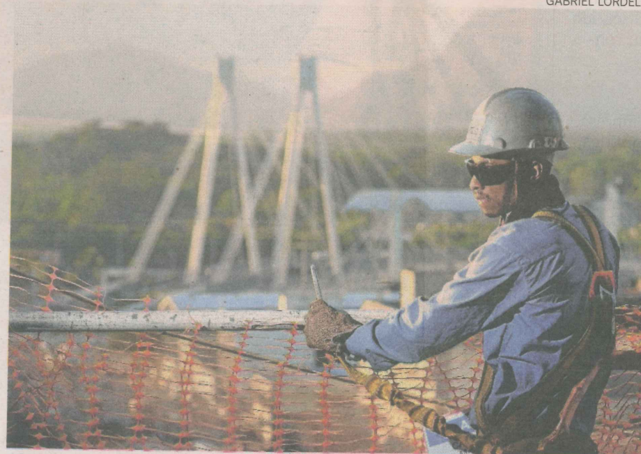
Obra na Reta da Penha deve ser inaugurada em fevereiro do ano que vem

implantados. O último deles só deve chegar em novembro e, por isso, a obra, prevista para terminar até o fim do ano, só deve ser entregue em fevereiro.