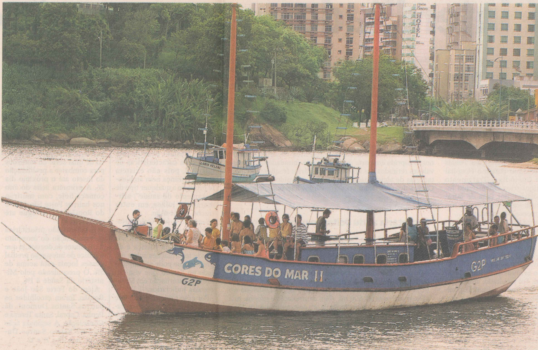
ÓTICA. Do mar, navegando nas escunas, é possível ver o litoral sob outro ponto de vista e, até mesmo programar uma festa com amigos a bordo.

“Sempre gostamos de atividades aquáticas e o Espírito Santo tem um potencial enorme. O próximo passeio que vou fazer é a Rota Manguezal”, disse Barboza.