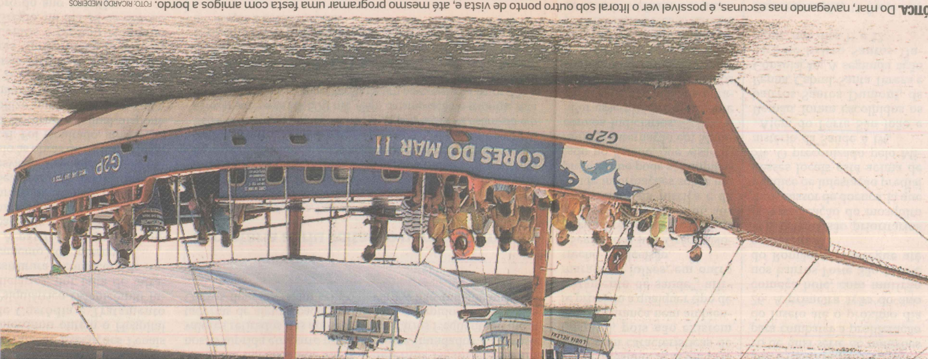
OTCA. Do mar, navegando nas escunas, é possível ver o litoral sob outro ponto de vista e, até mesmo programar uma festa com amigos a bordo.