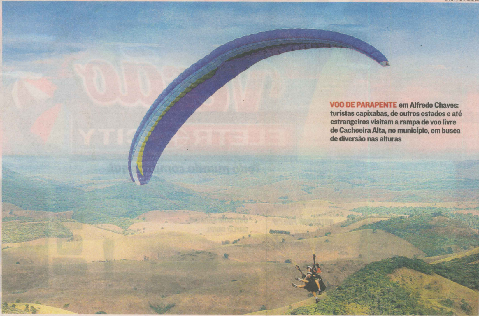
VOO DE PARAPENTE em Alfredo Chaves: turistas capixabas, de outros estados e até estrangeiros visitam a rampa de voo livre de Cachoeira Alta, no município, em busca de diversão nas alturas

O instrutor fica responsável pela confirmação ou cancelamento do voo, caso o dia agendado não apresente as condições climáticas adequadas para a prática do esporte.