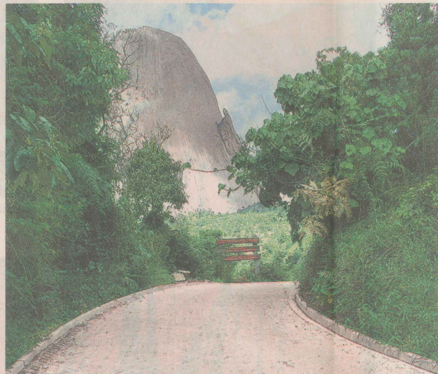
ROTA DO LAGARTO.

Recentemente, acompanhamos o Governador Paulo Hartung em viagem à Europa, onde assinamos convênio com instituições da região do Vêneto, norte da Itália, objetivando a instalar na região centro-serrana do Estado uma Escola de Formação