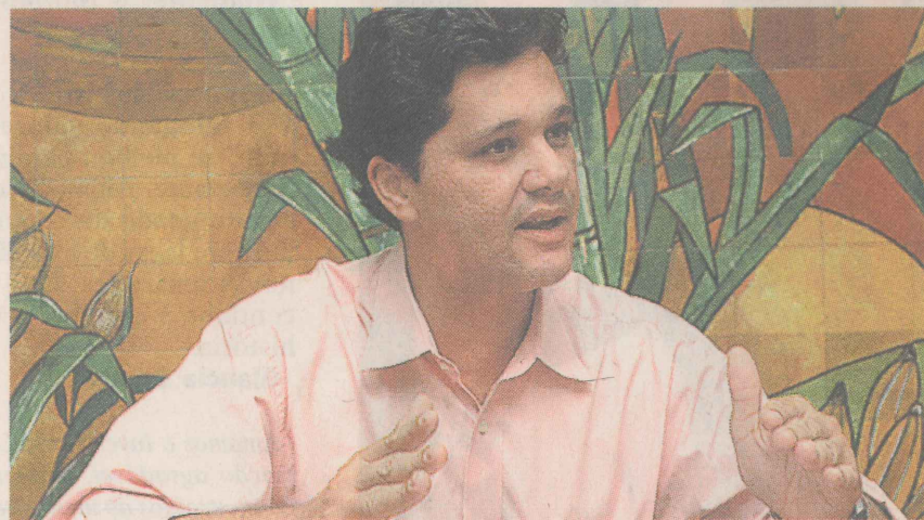
RICARDO FERRAÇO, SECRETÁRIO DE AGRICULTURA DO ES.

e os loteamentos irregulares que estão surgindo em toda a região, principalmente no entorno dos parques de Pedra Azul e Forno Grande, diag-