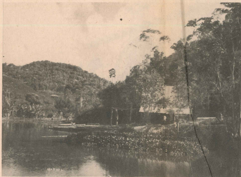
Este é o restaurante da Fazenda dos Lagos, já em funcionamento

Agora, como dissemos, uma nova opção vem nascendo. Trata-se da Fazenda dos Lagos, em local de fácil acesso e altamente privilegiado pela mãe natureza, com mata bem formada e bela cachoeira. Ali está nascendo um dos bons abrigos para os fins de semana dos capixabas que gostam dos locais bucólicos, onde a natureza tece seus mais bonitos recantos.