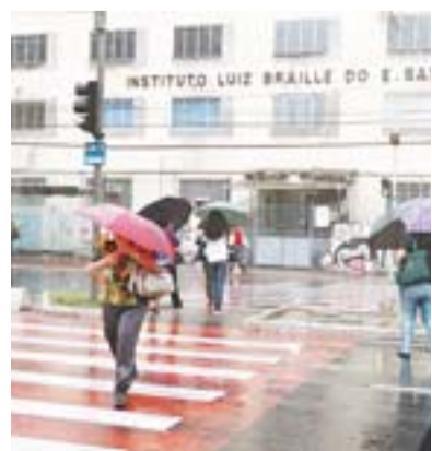
DIA FICOU chuvoso em Vitória

As chuvas que ocorreram durante a semana no Estado amenizaram a situação dos rios. No entanto, a previsão do tempo aponta que, a partir de hoje, o sol volta a brilhar em boa parte do Espírito Santo.