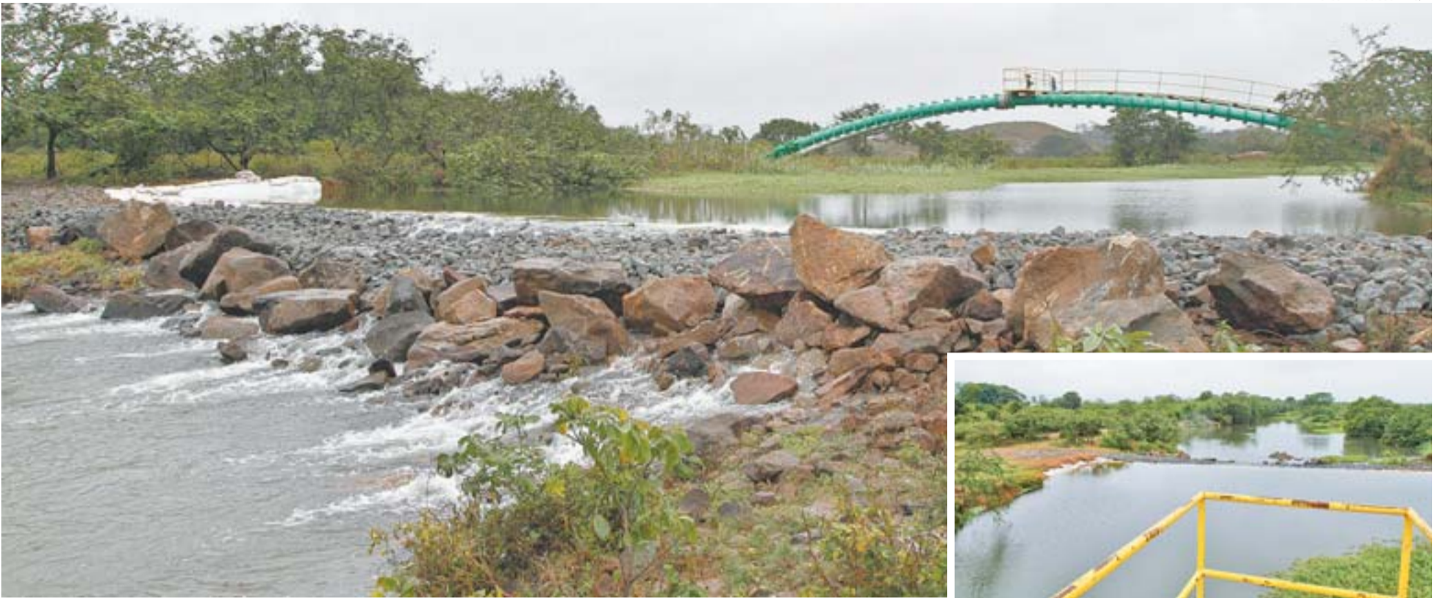
ÁGUA DO RIO JUCU começou a passar por cima da barragem no local de captação da Cesan (destaque) na madrugada de ontem. Chuva fraca, mas constante, foi positiva, dizem especialistas