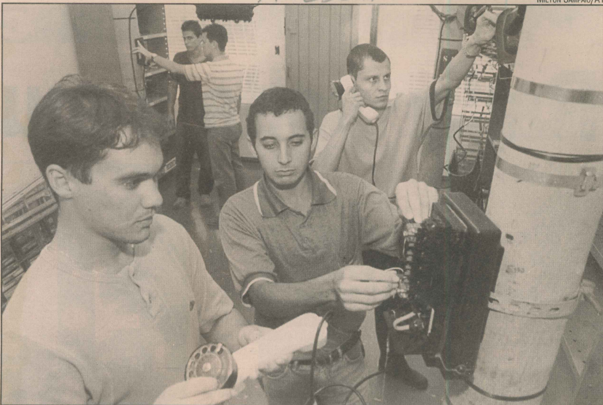
Os jovens com curso técnico em telecomunicações estão em alta no mercado

Cursos na área de petróleo são outra oportunidade para quem quer ganhar um bom salário, mesmo sem ter o diploma superior. O Centro de Ensino Federal Tecnológico do Espírito Santo (Cefet-ES) oferece vagas, cujas inscrições terminam nesta sexta-feira.