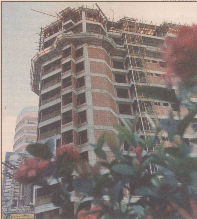
O setor de construção também é grande empregador no Estado