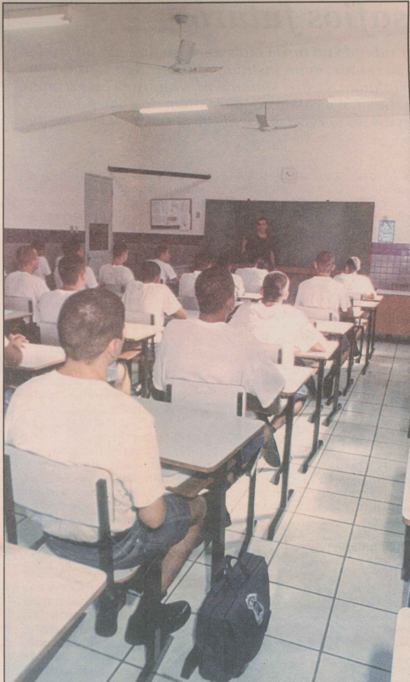
Aula na Escola de Aprendizes-Marinheiros: vagas para jovens